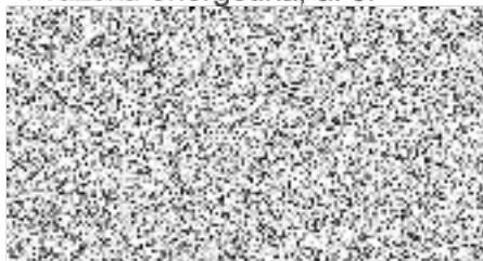
vedoucí sekce Prodej B2B